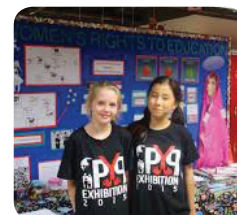
Alumnas realizando la exposición del PEP